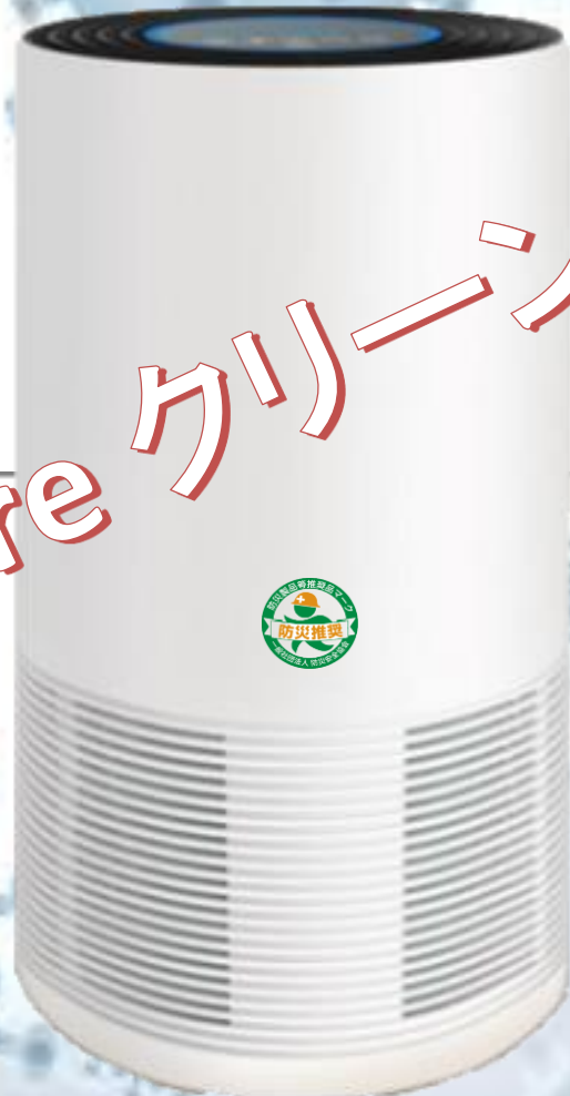
SAKURA 250 推奨広さ 30畳