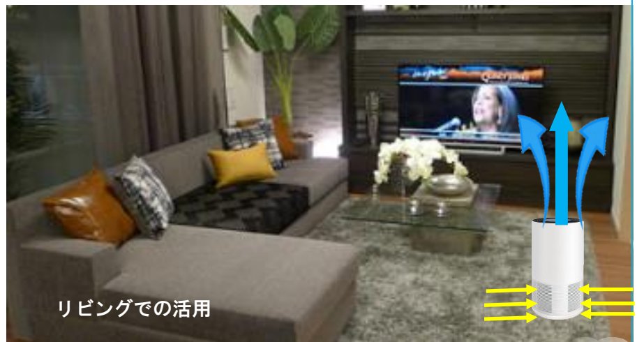
リビングでの活用