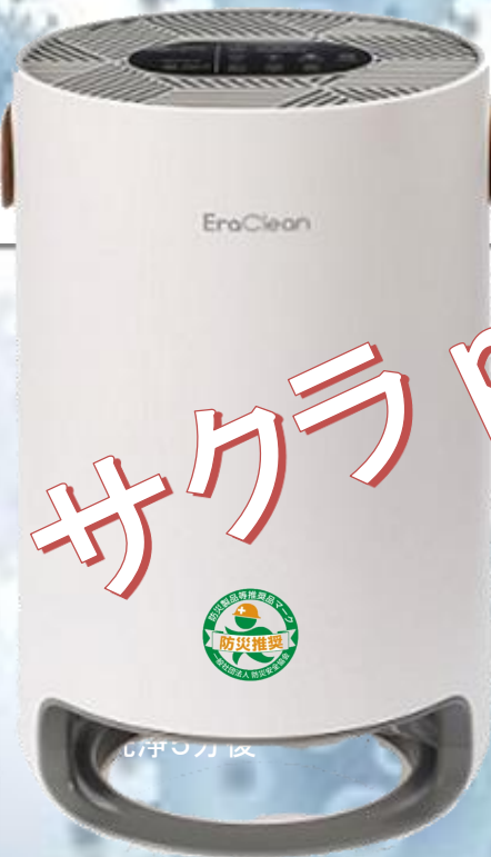
SAKURA 100 推奨広さ 8畳