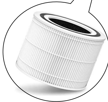
高性能HEPA フィルター

利用環境にもよりますがHEPAフィルターは1か月に一度程度清掃してください。2年程度での交換を推奨いたします